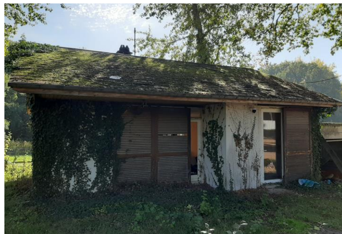
Photo bâtiment abandonné

En cas de réaménagement du bâtiment actuellement « abandonné » en accueil, l'accès à celui-ci devra pouvoir se faire par un cheminement accessible.